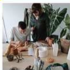
Bon cadeau atelier céramique