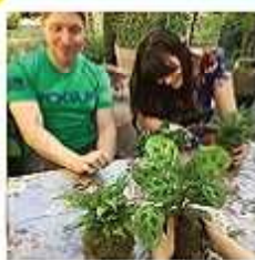
Bon cadeau atelier végétal