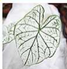
Bon Green t-shirt