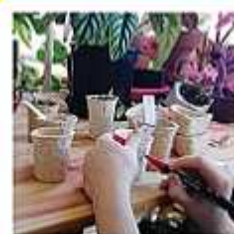
L'usine de petits pots...

Imagine et réalise un contenant ou un germeoir pour des plantes avec des objets de ton environnement